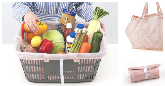
『レジカゴで使えるエコバッグ』<実用新案取得済>