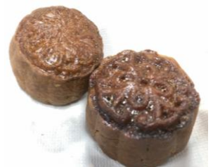
「Ashi Teishoku & Diner」の特注月餅